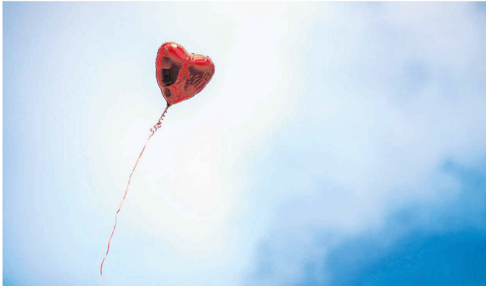
Ein einsamer Herzchen-Luftballon steigt auf: Hochzeitsfeiern werden wegen Corona ins kommende Jahr verschoben.

Bevor es losgeht, werden die Beamten-Anwärter aber erstmal für ihre neuen Aufgaben geschult. Löchner ist froh über die zusätzliche Unterstützung. „Schließlich ist die Nachverfolgung sehr aufwändig.“ Bianca Friefz